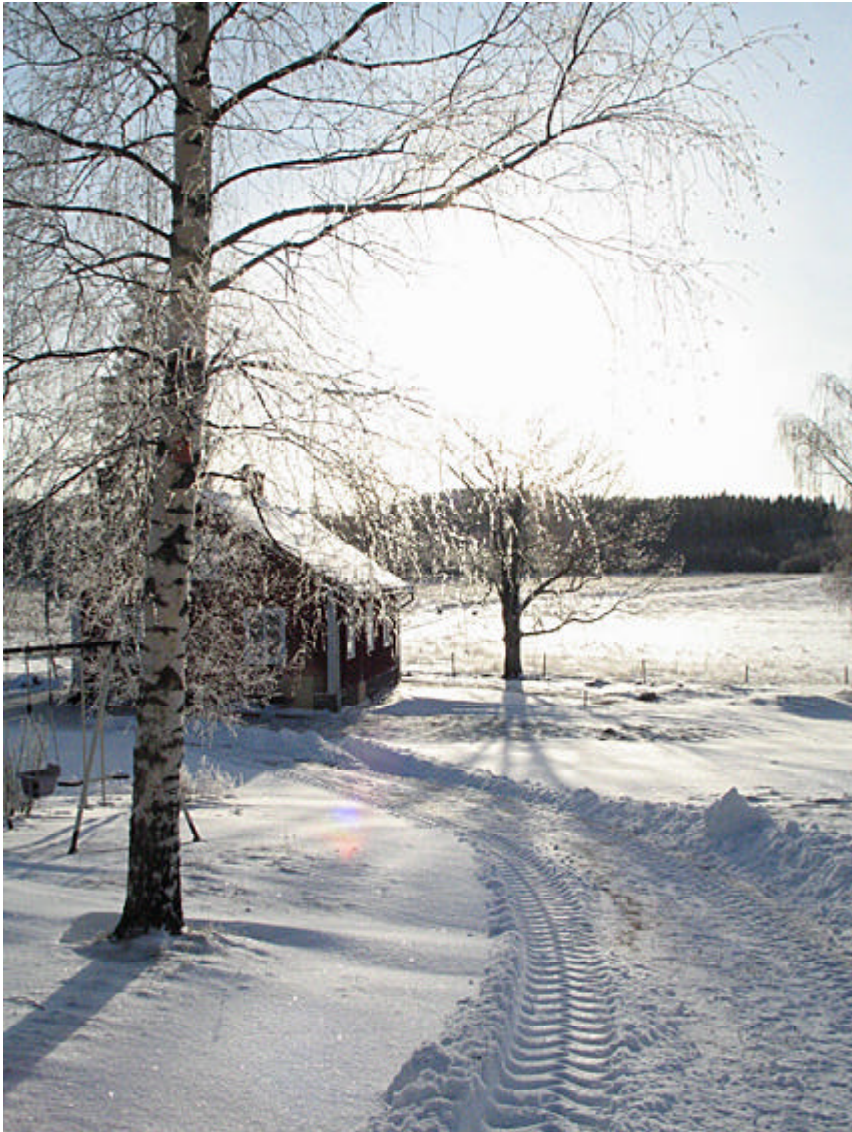
Bergsjö bygdegård